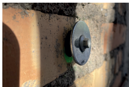
Foto 1: esempio di connettore tipo eventualmente da utilizzarsi su specifica raccomandazione del Progettista strutturale